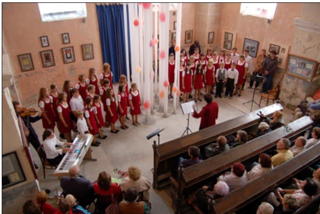
Zahájení výstavy uměleckých instalací Návrat svět(l)a . Synagoga Loštice. Dětský pěvecký sbor Větrník vystoupil s pásmem židovských písní a žalmů.

Radnice 4, 789 85 Mohelnice, Czech Republic Tel.: +420 583 455 912, Cell.: +420 775 264 206 E-mail: cromstil@yahoo.com ; www.respectandtolerance.com IC 269 89417. Bankovní spojení: KB 35-5957440267