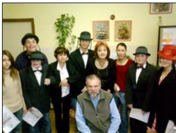
ZŠ Demlova, Olomouc Den věnovaný židovské historii, kultuře a tradicím. Žáci, učitelé a zástupce sdružení Respekt a tolerance.