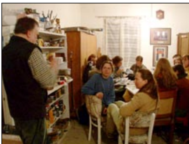
Studenti v knihovně sdružení Respekt a tolerance